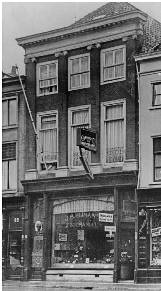
5. Voorgevel van het pand Wagenstraat 67-67a van J.B. Hijmans' Fotohandel voor de verbouwing, circa 1932.