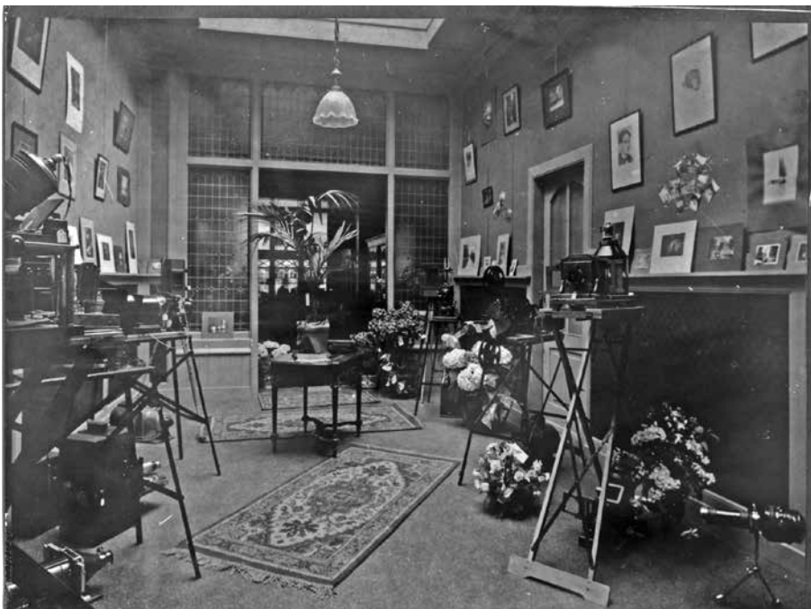
6. Wagenstraat 67, winkelinterieur vermoedelijk bij de opening van een expositie van een fotowedstrijd, circa 1920.

Hijmans' Fotohandel had die camera in het assortiment opgenomen.