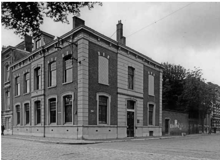
7. Hoofdkantoor van Hijmans' Foto- en Kinogroothandel NV, Muzenstraat 37. augustus 1943.

Gevestigde bedrijven die in de goede jaren waren opgericht en hun bedrijfsactiviteiten steeds zagen toenemen hadden moeite om zich aan te passen. Opkomende bedrijven kenden dergelijke problemen niet. Die hadden het voordeel dat zij goedkope en goed opgeleide medewerkers voor het uitkiezen hadden.