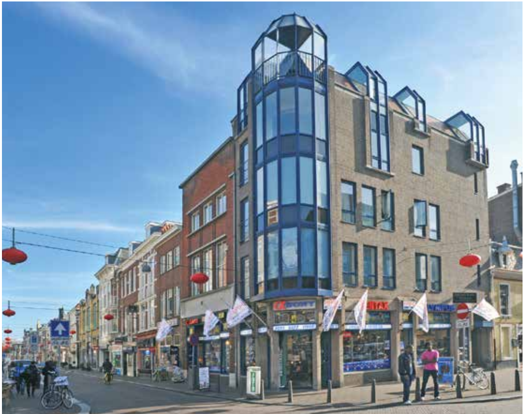
13. Huidige voorgevel van de Hafo, mei 2012.