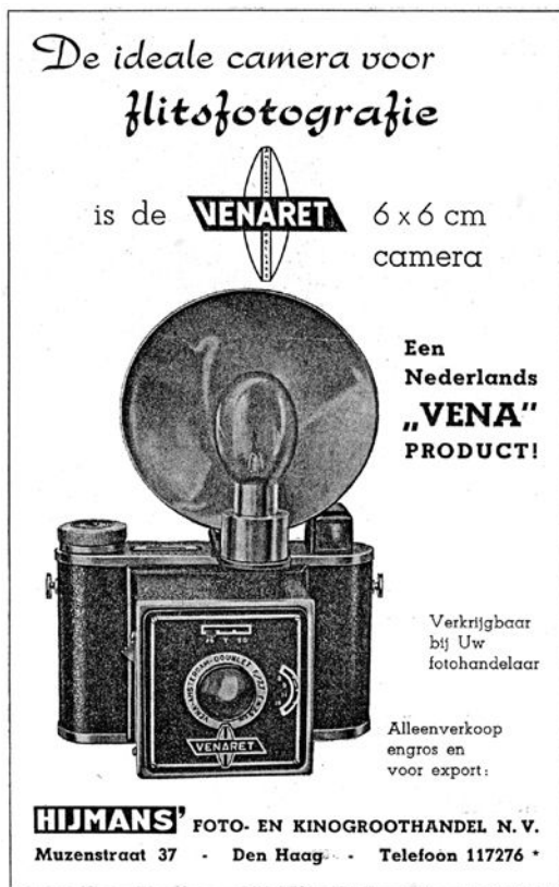
10. Advertentie voor de Venaret-camera, uit: D.A. de Korte, Flitsfotografie (Amsterdam, 1949).

werd om alle andere benodigde onderdelen zelf te gaan maken, tot aan de stempels toe. Het was zelfs nodig om een eigen spuit- en vernikkelinrichting aan te schaffen. Ondanks alles bleek het mogelijk een camera te bouwen met een