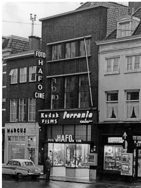
11. Voorgevel van het pand Wagenstraat 67-67a van J.B. Hijmans' Fotohandel in 1960.