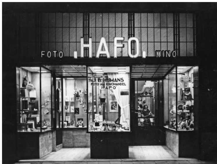
9. Voorgevel van de Hafo, Wagenstraat 67, in 1950.